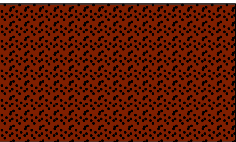
Tynk mozaikowy 504